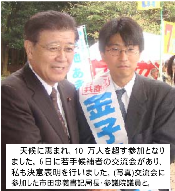
天候に恵まれ、10万人を超す参加となりました。6日に若手候補者の交流会があり、私も決意表明を行いました。(写真)交流会に参加した市田忠義書記局長・参議院議員と。